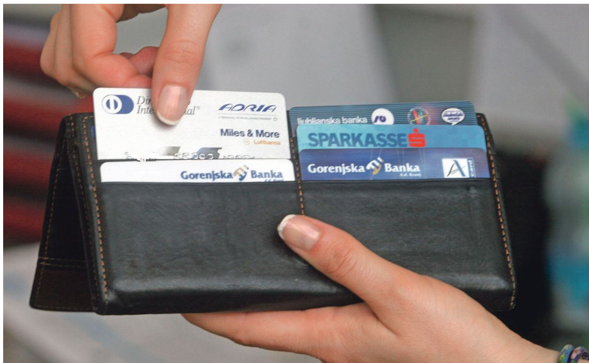
Prenos franšize iz enega podjetja v drugo pomeni, da se prenesejo pogoji poslovanja tako za imetnike kartic kot za trgovce.

Zamenjava izdajatelja je za imetnike kartic pomenila, da so morali podati soglasje o prenosu pogodbenega razmerja iz Intesa Sanpaolo Card v Banko Koper. A zapletov ni bilo. »Vsem obstoječim imetnikom american expressa smo poslali v podpis soglasje o prenosu poslovanja. V dopisu smo navedli pogoje in vse pomembne informacije. Določili smo datum, do katerega so morale stranke vrniti podpisano